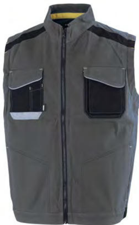
12 - GRIGIO 12 - GREY