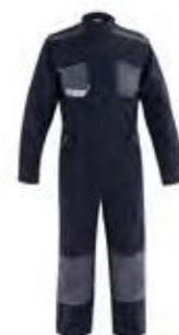
01 BLU 01 - BLUE