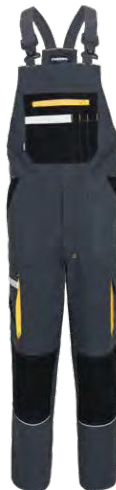
12 - GRIGIO 12 - GREY