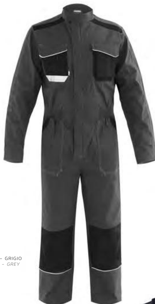
12 - GRIGIO 12 - GREY