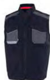
01 - BLU 01 - BLUE