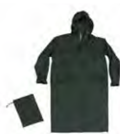
04 - VERDE 04 - GREEN

CE 1 A CATEGORIA PER RISCHI MINIMI 1 ST CATEGORY FOR MINIMUM RISKS