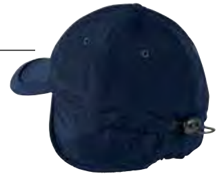
01 - BLU 01 - BLUE