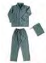
04 - VERDE 04 - GREEN