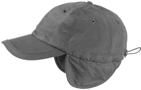
12 - GRIGIO 12 - GREY