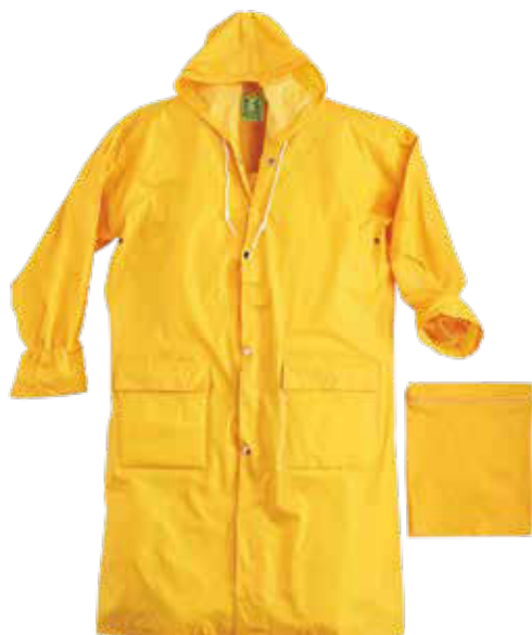
08 - GIALLO 08 - YELLOW