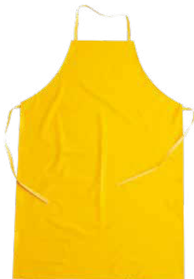
08 - GIALLO 08 - YELLOW