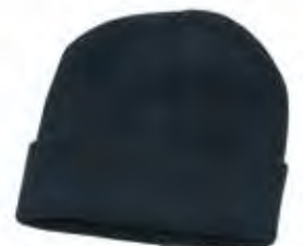
05 - NERO 05 - BLACK