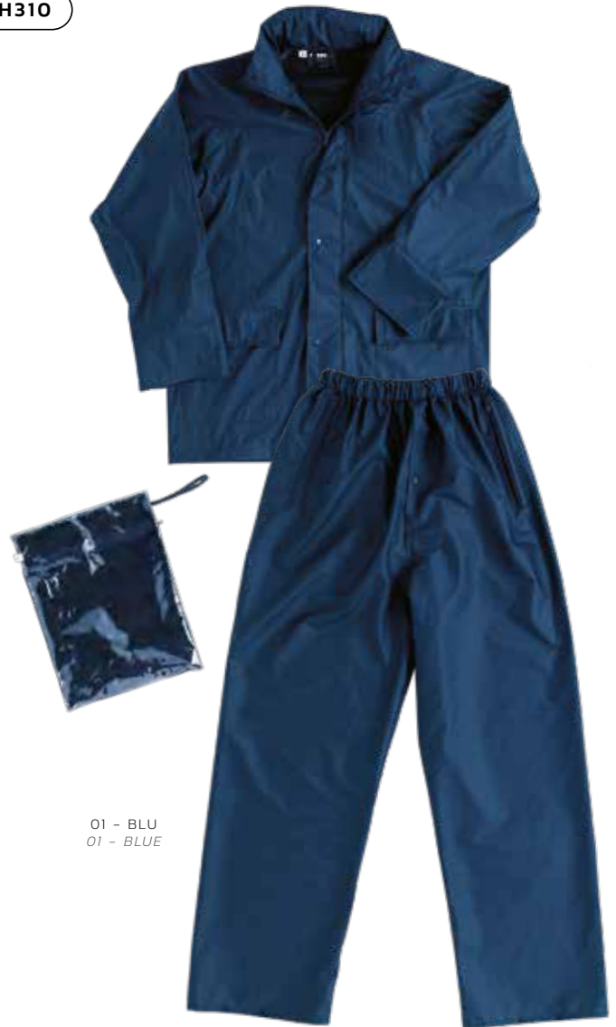
01 - BLU 01 - BLUE