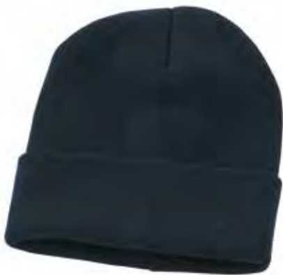
01 - BLU 01 - BLUE