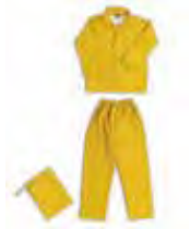
08 - GIALLO 08 - YELLOW