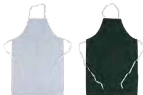
02 - BIANCO 02 - WHITE

CE 1 A CATEGORIA PER RISCHI MINIMI 1 ST CATEGORY FOR MINIMUM RISKS