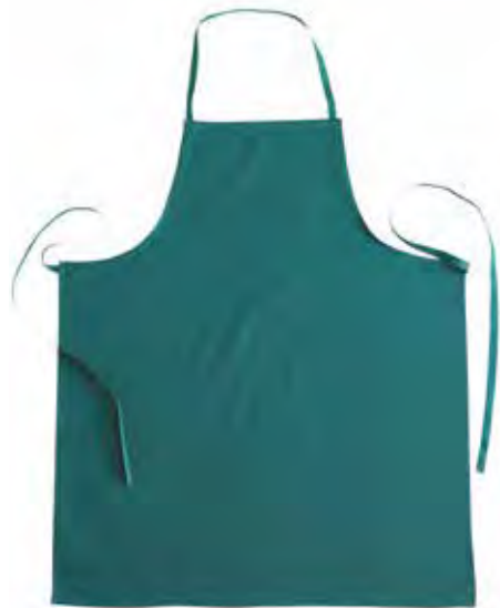
04 - VERDE 04 - GREEN