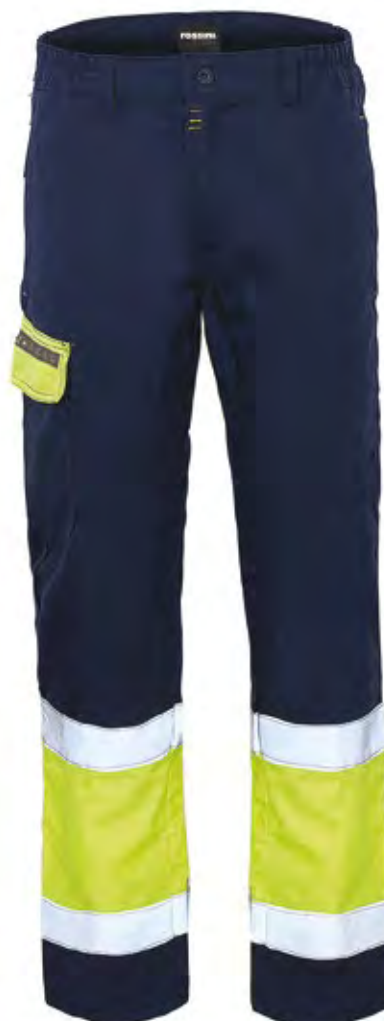
42 - GIALLO/BLU 42 - YELLOW/BLUE