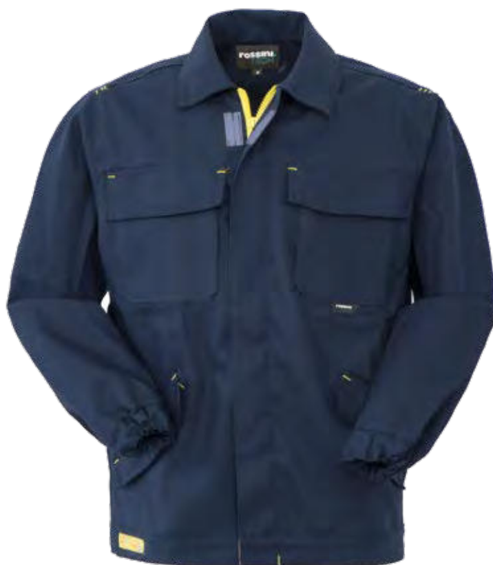
74 - SAILOR BLUE 74 - SAILOR BLUE