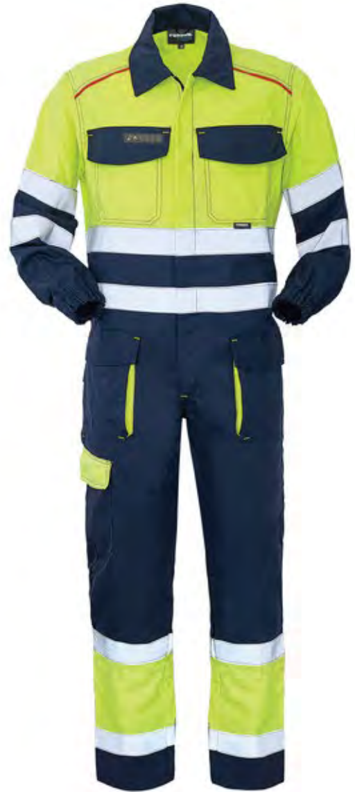
42 - GIALLO/BLU 42 - YELLOW/BLUE