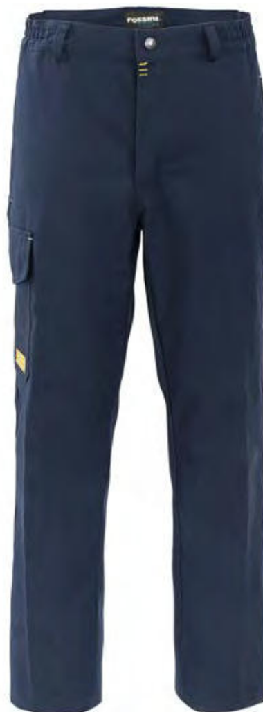
74 - SAILOR BLUE 74 - SAILOR BLUE