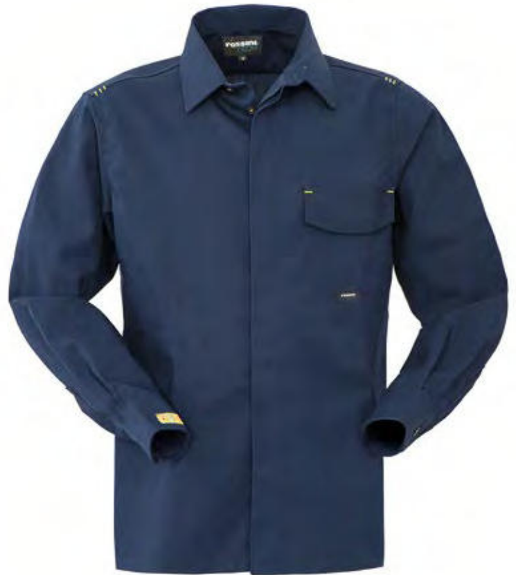
74 - SAILOR BLUE 74 - SAILOR BLUE