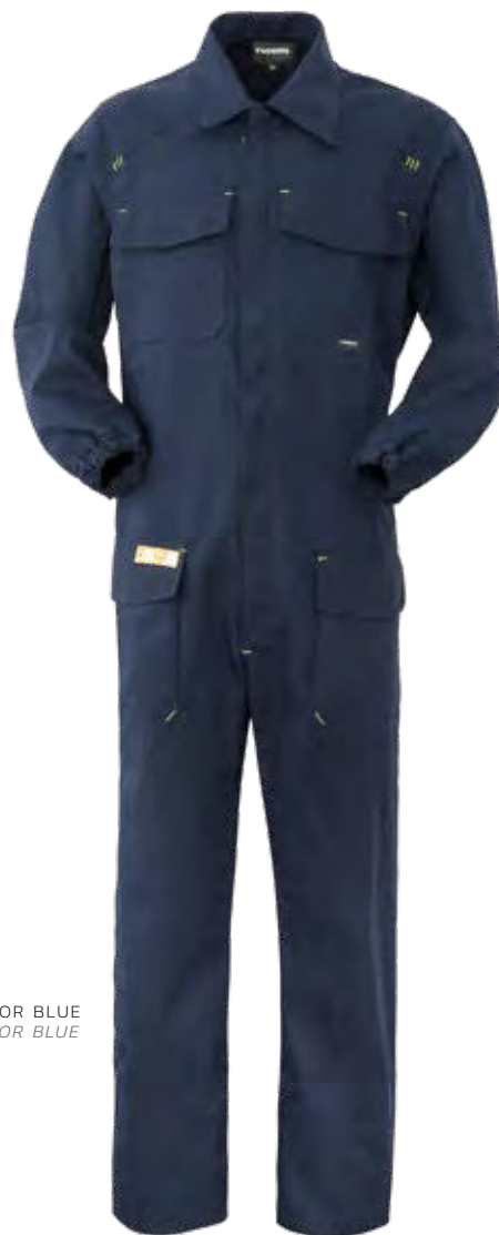
74 - SAILOR BLUE 74 - SAILOR BLUE