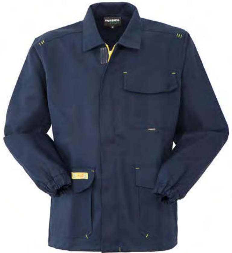
74 - SAILOR BLUE 74 - SAILOR BLUE