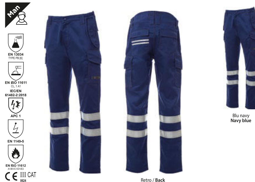
Blu navy Navy blue

Antistatic, antacid, flame-retardant, arc flash-resistant cotton trousers suitable for welders, higher fitted waist at back for better coverage with elasticated sides and belt loops at waist; zip and press-stud front fastening. Contrasting reinforced double seams on inner leg, outer leg and back. Classic-cut front pockets, two multi-function pockets plus a zip pocket and two back pockets, all with flap and velcro fastenings. Retro-reflective 3M stripes on back pocket.