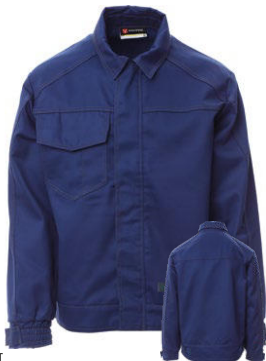
Retro / Back