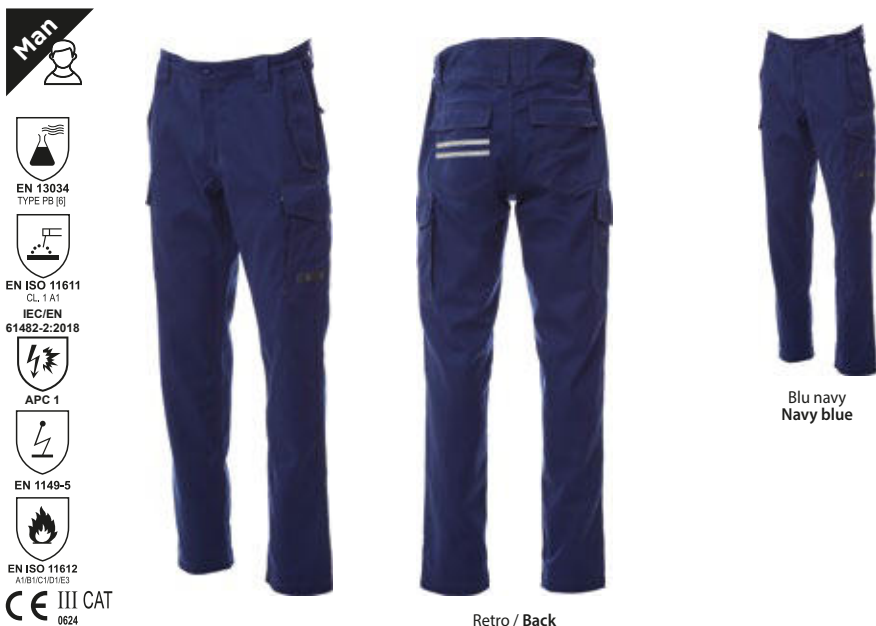
Blu navy Navy blue