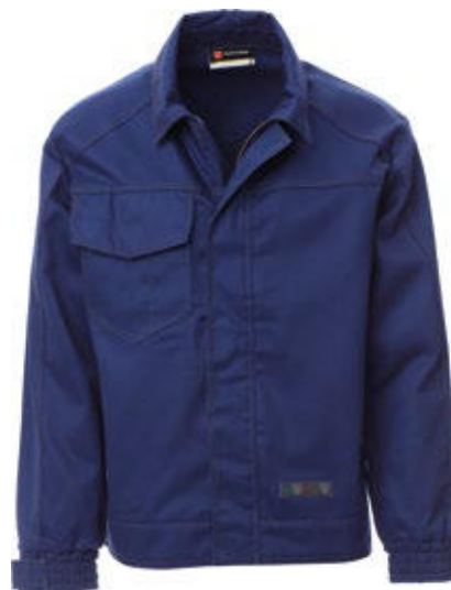
Blu navy Navy blue