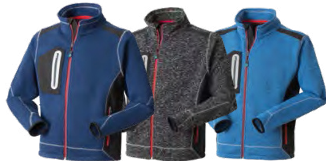
01 - BLU

Elastico interno in vita per migliorare l'aderenza al corpo, cuciture e travette a contrasto.