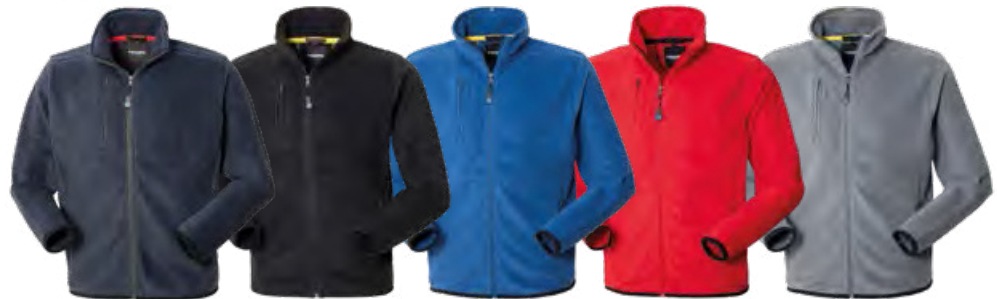
01 - BLU

Una tasca al petto destro con chiusura con cerniera verticale, due tasche anteriori interne oblique chiuse con cerniera, travette di colore a contrasto.