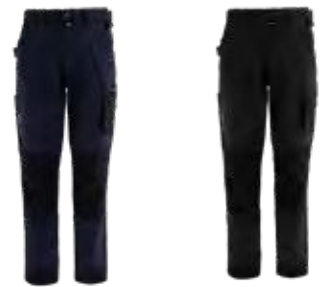
01 - BLU 01 - BLUE