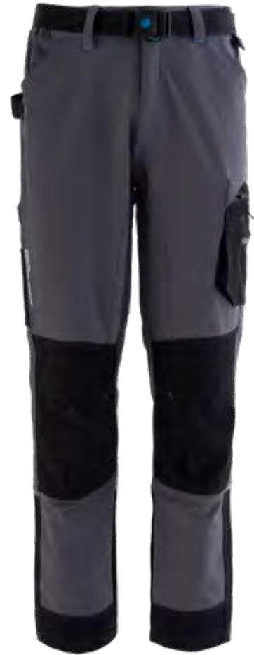
12 - GRIGIO 12 - GREY